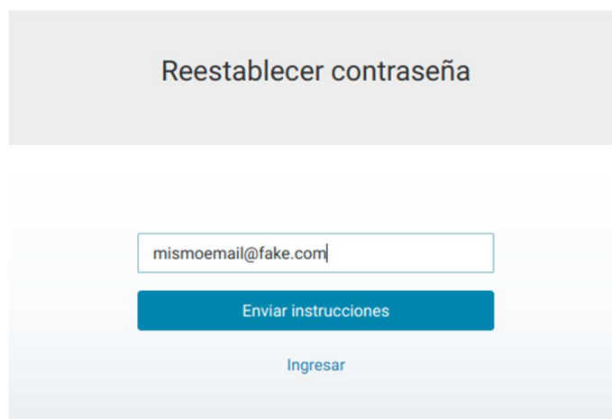
Formulario de recuperación de contraseña - Envío de email

Este enlace lo redirigirá a la sección donde se le solicitará el email registrado en nuestro sistema.